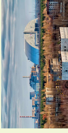
NAJWIĘKZY MOBILNY SARKOFAG OCHRONNY W CZARNOBYLU

W naszym dorobku mamy szereg niesamowitych projektów, np.: